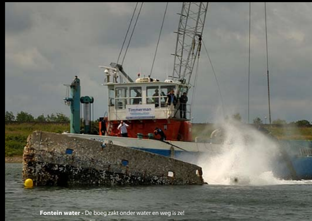
Fontein water - De boeg zakt onder water en weg is ze!

Grevelingenmeer, ter hoogte van afzinklocatie Le Serpent, 10:00. Tijd om af te zinken! Symbolisch wordt de Zeeuwse vlag gestreken op het wrak waarna twee enorme slangen zeewater in de ruimen beginnen te pompen. Een helikopter vliegt over, boten scharen zich bijeen om niets te missen van dit spektakel. Langzaam, heel langzaam begint Le Serpent te zakken. Na bijna anderhalf uur is het zo ver: de eerste stralen water lopen