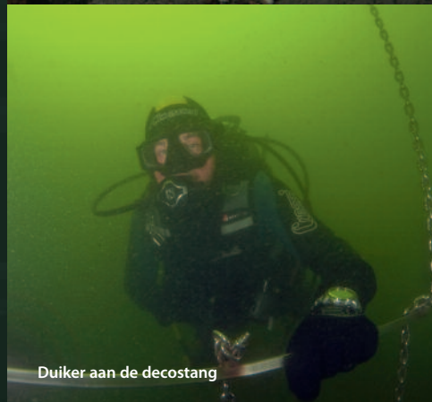
Duiker aan de decostang