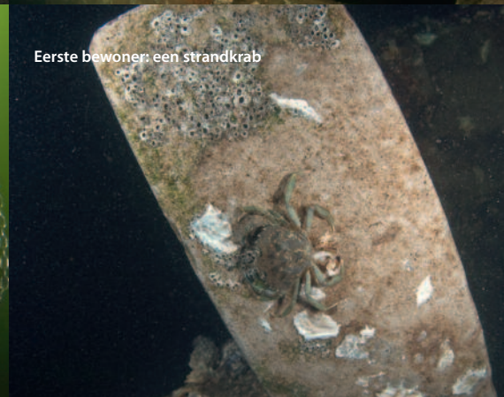
Eerste bewoner: een strandkrab