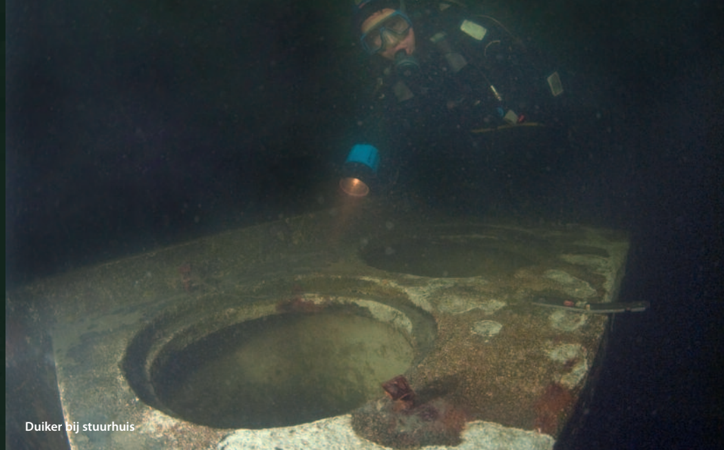
Duiker bij stuurhuis