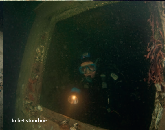
In het stuurhuis