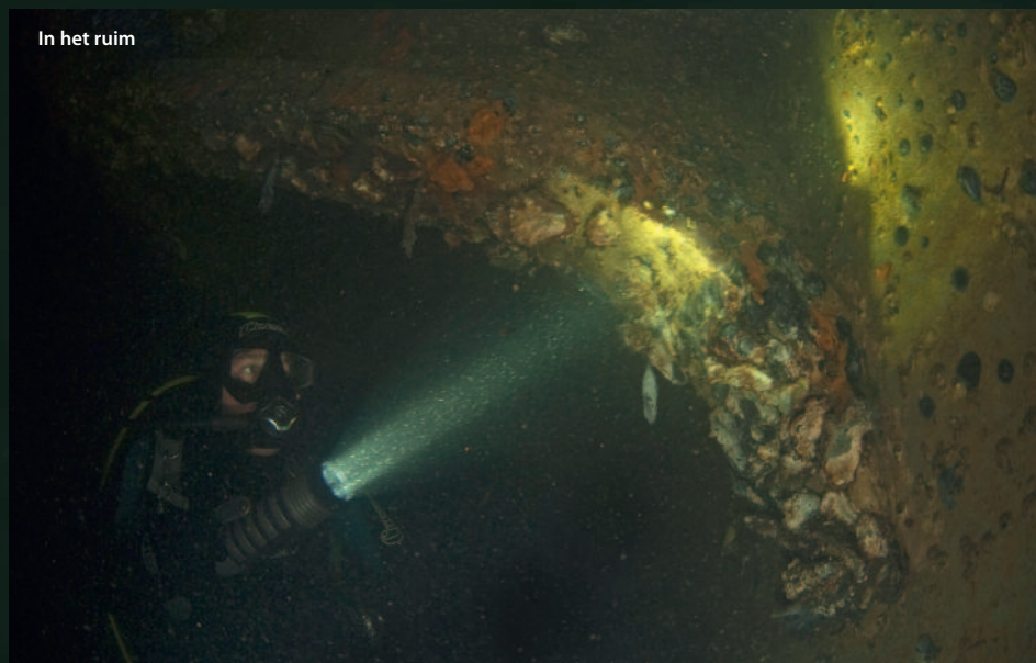
In het ruim

Schreeuwende mensen en knappende kabels. De Serpent ging ervandoor. Sprakeloos werd er daarna naar de luchtbellen gestaard die langzaam afdreven naar de diepte van de Grevelingen. Zoeken waar de slang was gebleven had