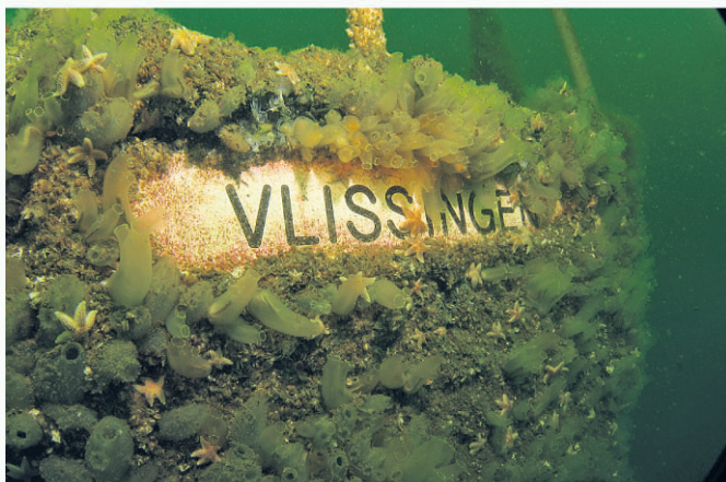
Achtersteven van De Zeehond

www.duikwrak.nl , www.de-kabbelaar.nl , www.divedivedive.nl