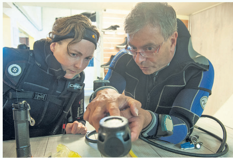
Ferry geeft nog een laatste instructie voor de duik