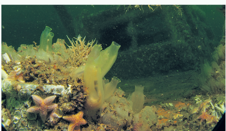
Een begroeide boeg

infographic Felix Biniewicz