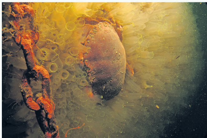
De boeg van De Rat