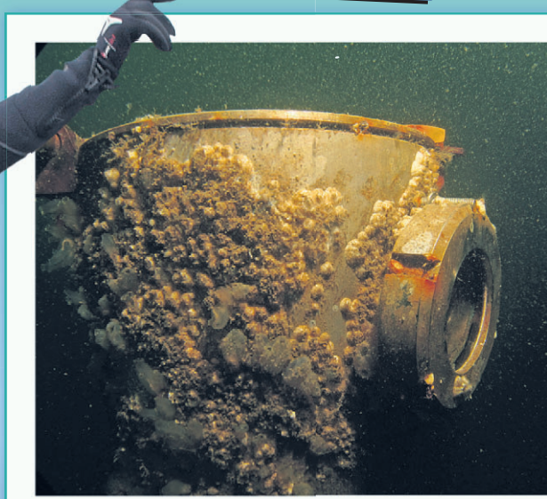
De webcam zit in de paal verborgen